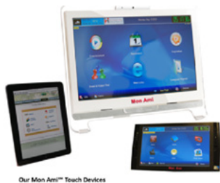
Our Mon Ami™ Touch Devices

Mon Ami : Un compagnon électronique qui permet à un aidant naturel de s'occuper à distance d'un être cher grâce à une foule de services. Pour aider l'utilisateur dans ses activités quotidiennes, le site multilingue Ami™ peut annoncer les médicaments, les repas ou les rappels d'exercices, contrôler automatiquement les lumières et les appareils, émettre des rappels pour les événements extérieurs, les rendez-vous ou les journées spéciales dans la vie de la famille et des amis, informer le soignant si des mesures doivent être prises et de nombreuses autres fonctions utiles.